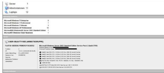
Abb. 2: Beispieldarstellung Inventarisierung

Behalten Sie mit dem CND IT Sentinel stets den Überblick über Ihre aktuelle IT-Landschaft.